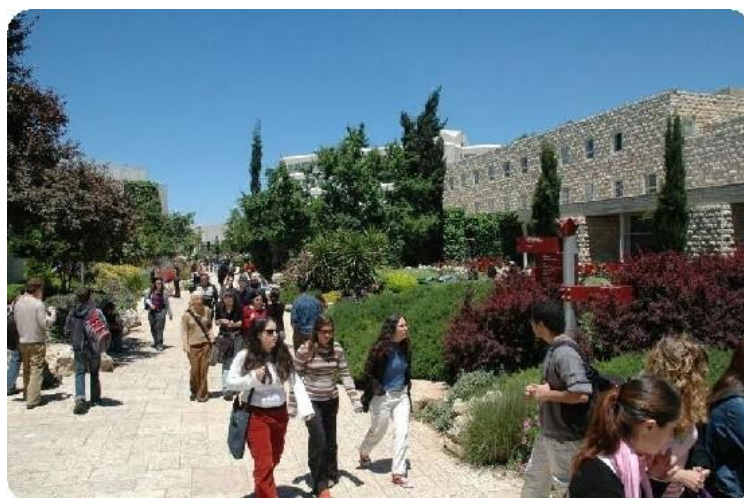
L'Université hébraïque de Jérusalem

L'Université hébraïque de Jérusalem s'est classée quatrième dans la catégorie Logique.