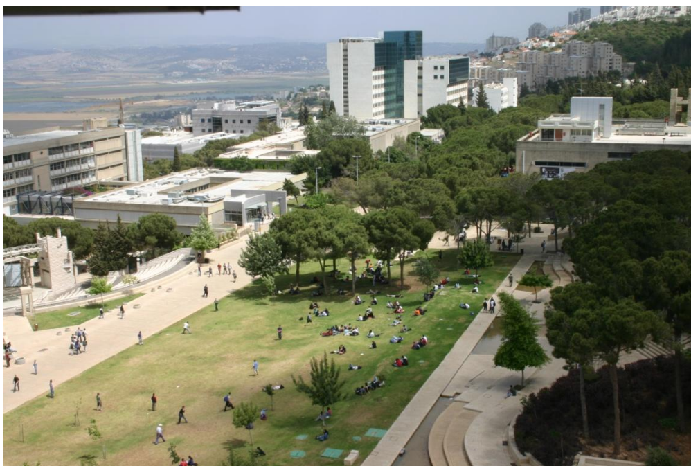
Technion - Israel Institute of Technology. | טכניון

Le CWUR a également publié un classement annuel des plus grandes universités du monde. Il est le seul classement mondial qui mesure la qualité de l'éducation et de la préparation des élèves, ainsi que le prestige des professeurs et la qualité de leurs recherches sans se fonder sur des enquêtes et des données envoyées par les universités.