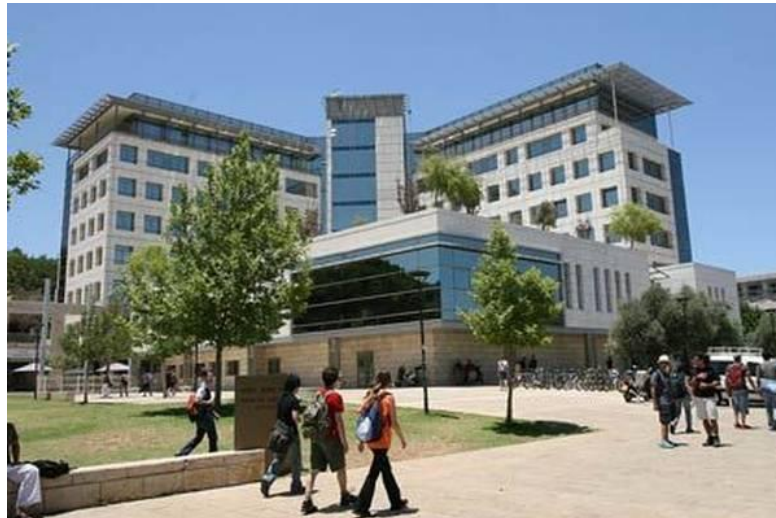
Technion - Israel Institute of Technology.

Le Technion - Israel Institute of Technology de Haïfa, a été reconnu par le Center of World University Ranking 2017, le classement mondial des universités créé en Arabie Saoudite , et dont le siège social est situé aux Émirats Arabes Unis , comme la meilleure université au monde dans le domaine de l'ingénierie aérospatiale.