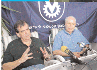
Aaron Ciechanover et Avram Hershko, Prix Nobel de Chimie 2004

Churchill pour chaque bourse d'une période complète. Une lettre de remerciements sera envoyée au donateur par chaque étudiant diplômé qui recevra une bourse d'étude pour une période complète (Maîtrise ou Doctorat) dans le cadre du programme. Le donateur aura l'opportunité de rencontrer son étudiant lors de ses visites au Technion. Le donateur recevra une invitation à la soutenance et cérémonie de la thèse.